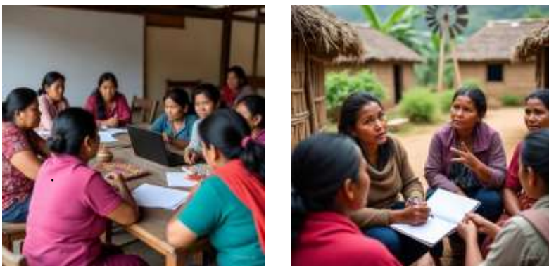
Gambar 1 dan 2: Diskusi Pemberdayaan Perempuan Desa melalui Pelatihan Digital

Perempuan desa tengah mengikuti sesi pelatihan keterampilan digital dan kewirausahaan berbasis komunitas. Kegiatan ini bertujuan untuk meningkatkan literasi digital, mendorong partisipasi aktif dalam pengelolaan ekonomi kreatif, serta memperkuat peran perempuan dalam pengambilan keputusan dan pengelolaan usaha mikro di lingkungan pedesaan.